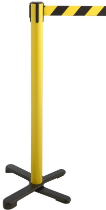
Abb. 1: GLA 10-E/17

Effektiv sperren – platzsparend aufbewahren.