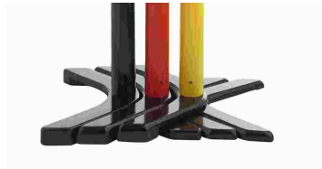
Abb. 2: Anwendungsbeispiel bei Nichtgebrauch