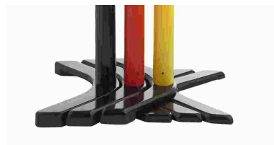
Abb. 2: Stockage facile et économique