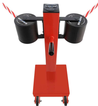
Fig. 2: GLA 2000-D