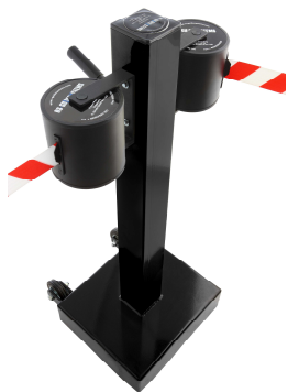
Fig. 1: GLA 2000-J