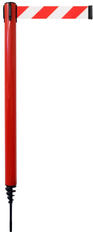
Fig. 1: GLA 24-D/13-4,0