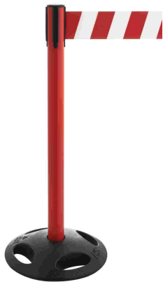
Abb. 1: GLA 26-D/13