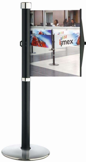
Abb. 1: GLA 30-A