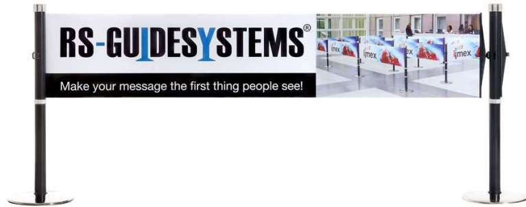
Abb. 2: Anwendungsbeispiel