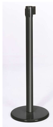
Fig. 3: GLA 45-A