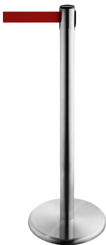
Fig. 1: GLA 45-S