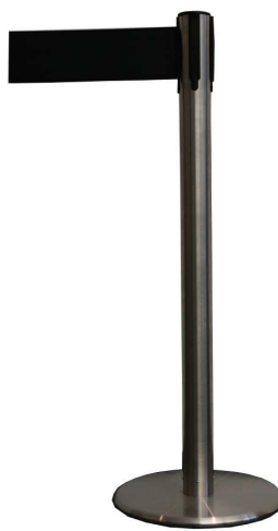
Abb. 2: GLA 46-A (Metall, anthrazit - Gurtband schwarz)