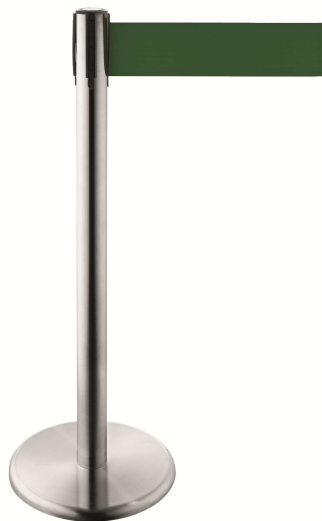
Abb. 1: GLA 46-S (Edelstahl – Gurtband grün)