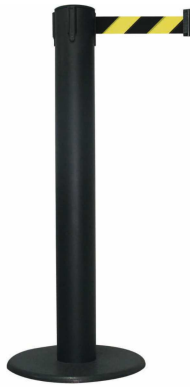
Fig. 1: GLA 85-J/17