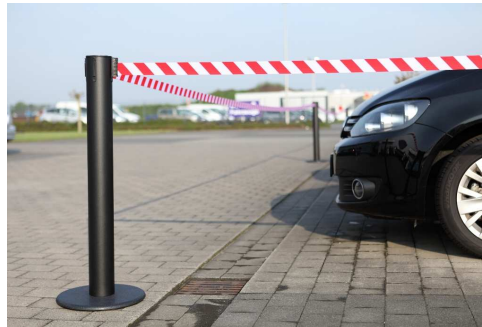
Fig. 2: GLA 85-J/13