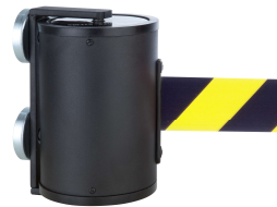
Abb. 2: Wandmontage GLWM 1000-17