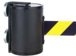
Fig. 2: support mural GLWM 1000-17 (fixation par aimant)