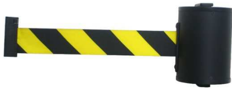
Fig. 1: support mural GLW 1000-J/17