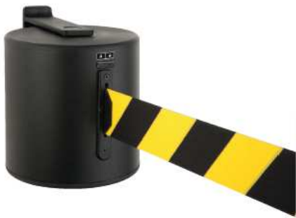
Abb. 1: GLW 2000-17