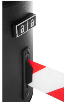
Abb. 2: Rastsicherung