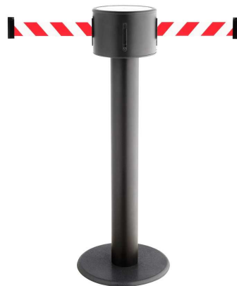
Fig. 2: GLAD 85-J/13