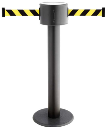
Fig. 1: GLAD 85-J/17