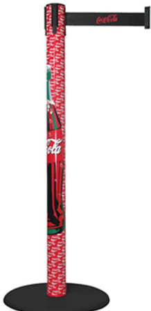
Abb. 1 GLA 15 mit Folierung