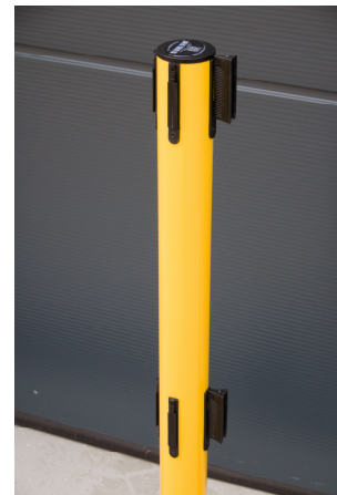
Pict. 3: GLA 250-E/17-4,0

Poids de base en matériaux composite recyclé Le tube de poteau peut être recyclé à 100 %.