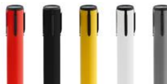
Abb. 3: Weitere Farbbeispiele