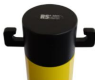
Abb. 2: Metall-Kopf mit 2 angeschweißten Haken