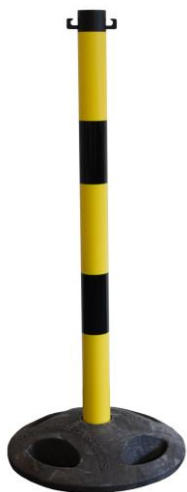
Abb. 1: GLAH 25-M