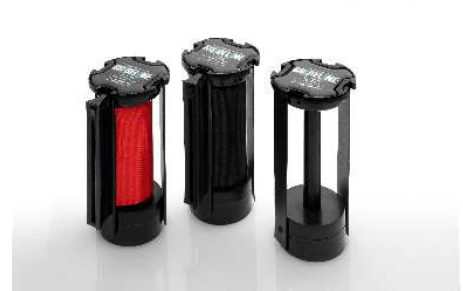
Abb. 3: Muster Gurtkassetten 100 mm Gurtbreite