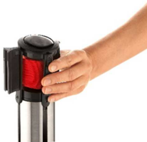
Abb. 2: Einsatz