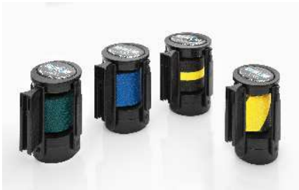
Abb. 1: Farbbeispiele 50 mm Gurtbreite