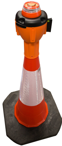
Pict. 1: ALCT-FL = lampe pour ALCT-O (cône non-inclus – mais disponible)