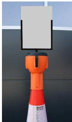
Abb. 2: ALCT-SH Schildtafel (DIN A4) auf Leitkegel ALCT-O (Leitkegel und -aufsatz nicht im Lieferumfang enthalten - optional erhältlich)