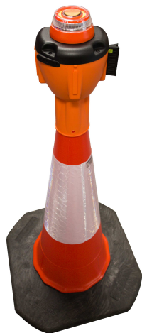
Abb. 1: ALCT-FL Blinklicht auf ALCT-O Leitkegelaufsatz (Leitkegelaufsatz und Leitkegel nicht im Lieferumfang enthalten - optional erhältlich)