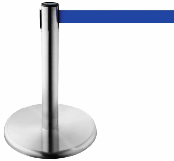
Abb. 1: GLAK 45-S