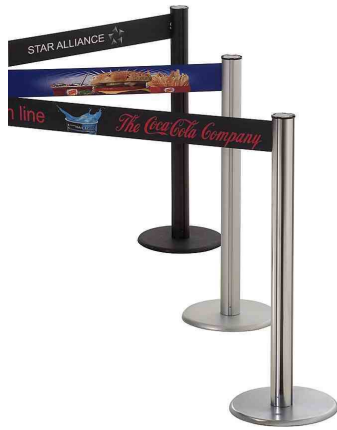
Fig. 1: GLA 75