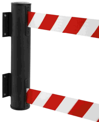
Pict. 1: GLWD 25-J