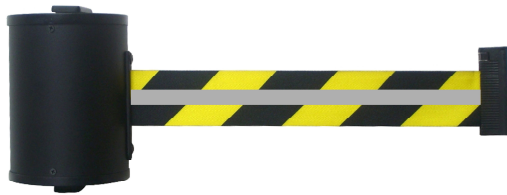
Abb. 1: GLW 700-J/17R

Flexibel in Ausrichtung und Auszugslänge.