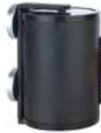
Abb. 2: Magnetische Befestigung