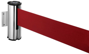
Abb. 1: GLW 75-P