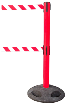
Abb. 1: GLA 250-D/13-4,0