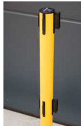
Abb. 3: GLA 250-E/17-4,0

Bodenteller hergestellt aus Recyclingmaterial! Pfostenrohr 100 % recycelbar