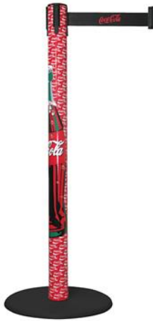
Abb. 1: GLA 15-Druck