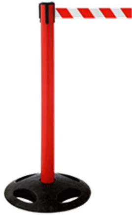
Abb. 1: GLA 25-D/13-4,0