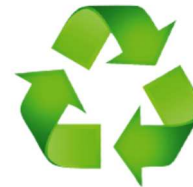
Abb. 3: Bodenteller aus Recyclingmaterial